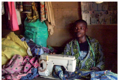
Der junge Mann aus der DR Kongo erhielt einen Kleinkredit für eine Nähmaschine und kann sich so seinen eigenen Lebensunterhalt verdienen.