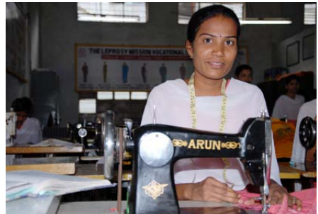
Ausbildung zur Schneiderin an der Berufsschule Nashik, Indien.