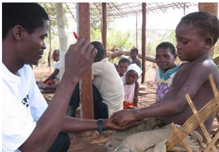
Ein freiwilliger Helfer untersucht den Tastsinn einer kleinen Patientin in Mosambik.