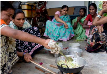
Salur, Indien: Leprabetroffene lernen wie man kocht ohne sich zu verbrennen.

Die Provinz Yunnan grenzt an Tibet, Burma, Laos und Vietnam. Wegen des schwierigen Terrains, kriegerischen Scharmützeln in den Grenzregionen, ungenügender Ausbildung