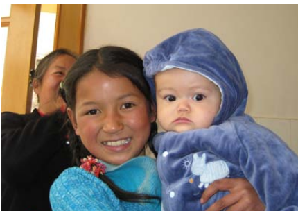
China: Das Mädchen links wächst in einer Leprakolonie auf. Dank der Lepra-Mission kann sie trotzdem die Schule besuchen.

Der Bürgerkrieg in der DR Kongo macht den Menschen schwer zu schaffen. Die Lepra tritt häufig auf, Krieg und mangelnde Infrastruktur erschweren es, Hilfe bis in entlegene Dörfer zu bringen. Zusammen mit der staatlichen Gesundheitsvorsorge arbeitet die Lepra-Mission daran, leprabetroffene Menschen zu finden. In den Dörfern werden die Menschen gelehrt, frühe Zeichen von Lepra zu erkennen. Im Bereich der sozialen Eingliederung wird den Betroffenen geholfen, Schweine, Kaninchen oder Hühner zu züchten und Gemüse anzubauen. Leprabetroffene können auch Mikrokredite erhalten um eine kleine Unternehmung zu gründen, mit der sie wirtschaftlich unabhängig werden können.